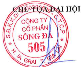
Đặng Tất Thành